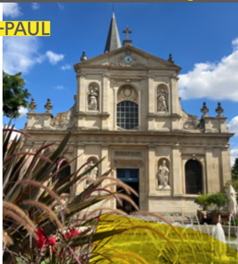
ville de Rueil-Malmaison